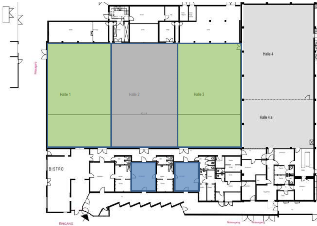
Abbildung 1: Wettkampfstätte Halle 1-3